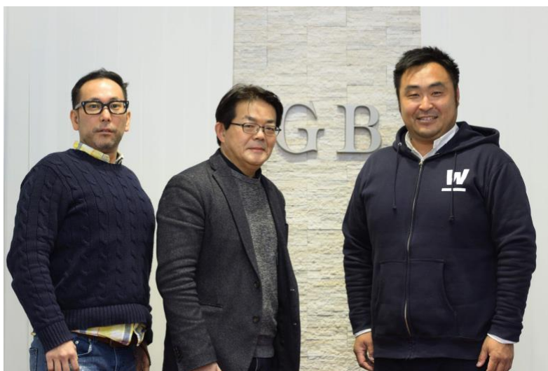
グローバル・ブレイン株式会社